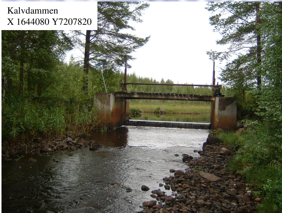
Kalvdammen X 1644080 Y7207820